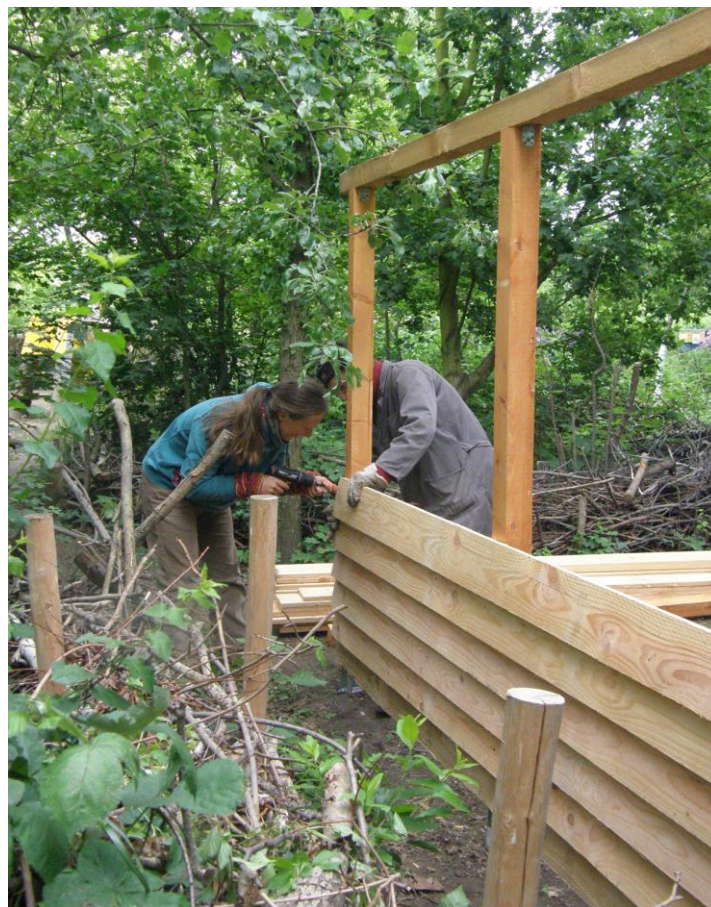
Anbringen der Wandbretter