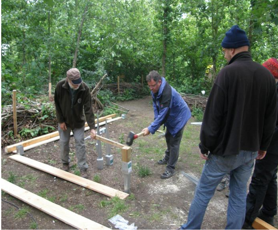
Start: Sortieren der Materialien und Ausmessen der Grundfläche (9 m 2 )