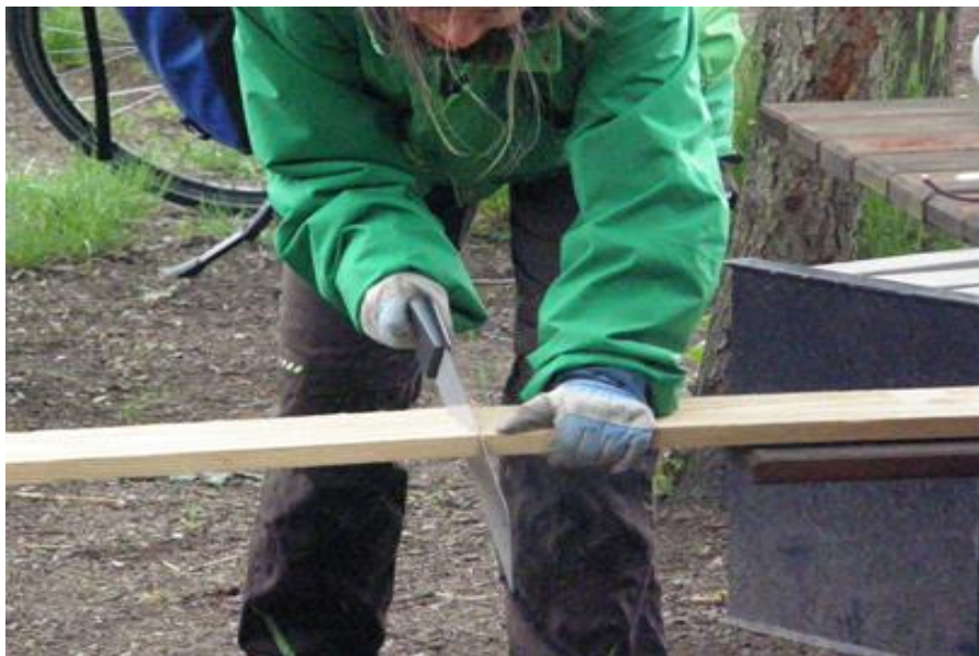
Zusägen des Holzes; Bauen der Tür und des Fensterrahmens